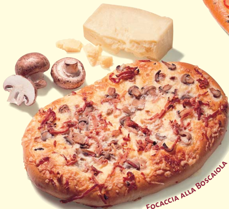
FOCACCIA ALLA BOSCAIOLA