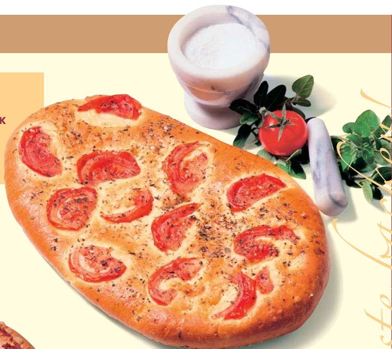
FOCACCIA ALLA BARESE

MEISTERTIPP: GEBEN SIE BEIM HERSTELLEN DER FOCACCIA GRUNDREZPTUR 0,500 KG KOMPLET PESTO-SNACK ODER KOMPLET TOMATO-SNACK DAZU UND SIE ERHALTEN EINEN NOCH WÜRZIGEREN UND AROMATISCHEREN TEIG.